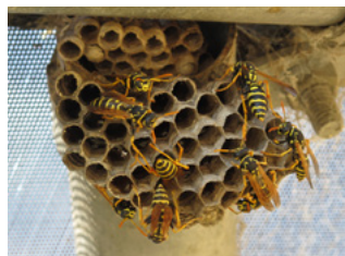
Nido de avispa de papel