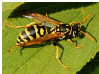
Avispa de papel